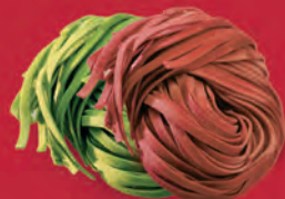
TAGLIOLINI VERDI / ROSSI